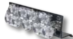
HC-CARGO 171780 Takedown (Feu de travail), 9 LED, blanc