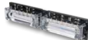
HC-CARGO 171778 Xtreme Module d'angle clignotant, 12 LED, ambre