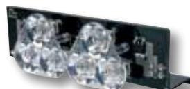
HC-CARGO 171779 Takedown (Feu de travail), 6 LED, blanc