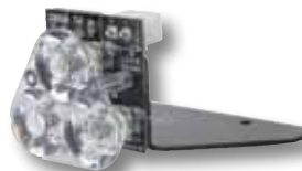
HC-CARGO 171781 Alley light (Feu de patrouille), 3 LED, blanc